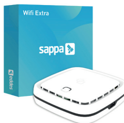
Sappa Wifi Extra